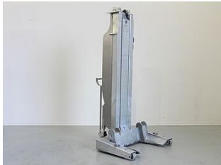
EHB907DC01-H-VZ Feuerverzinkung für Hebebock EHB90xDC