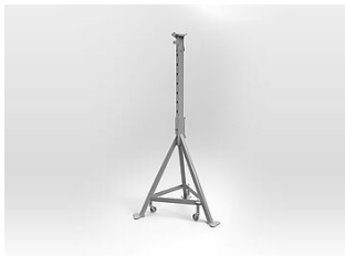
HS08LR Abstützbock, 8,2 t, 1260-1990 mm