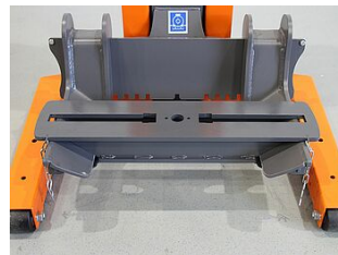
EHB907TRT412TR01-50 0 Grundtraverse 880 mm, Traktoraufnahme vorne