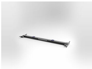
EHB905TR113500 Traverse, 11 t, Länge 3500 mm