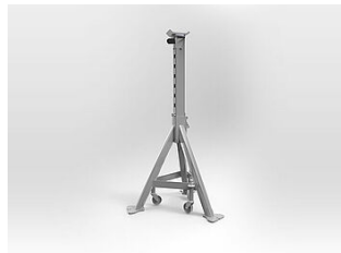
MS08LR Abstützbock, 8,2 t, 790-1270 mm