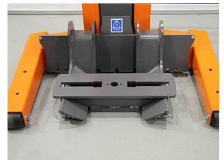
EHB907TRT412TR02-50 0 Grundtraverse 640 mm, Traktoraufnahme hinten