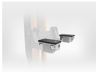
EHB907-LS-PR503-500 Lastaufnahme, steckbar auf Radgabeln