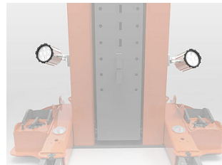
EHB907SPOT02 2 LED-Strahler