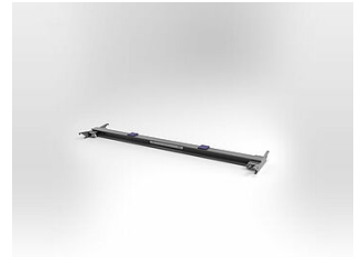
EHB905TR113000 Traverse, 11 t, Länge 3000 mm