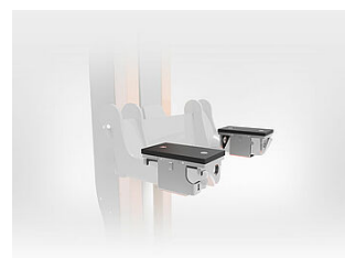
EHB907-LS-PR503-385 Support de charge, accrochable