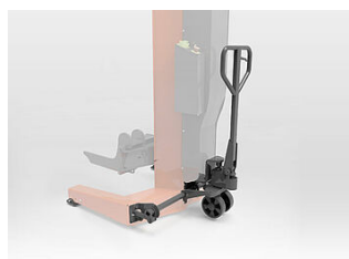
EHB907TDH Chariot hydraulique