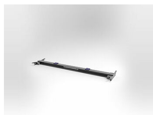
EHB907TR17 Traverse PL, 17 T, longueur 3000 mm