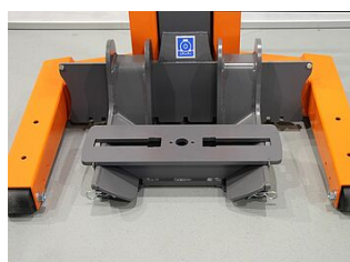
EHB907TRT412TR02-38 5 Traverse de base 640 mm, pour le tracteur à l'arrière