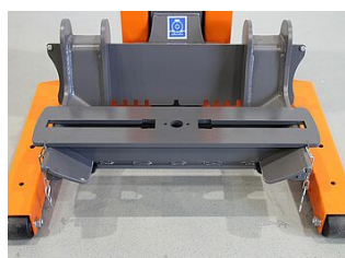
EHB907TRT412TR01-38 5 Traverse de base 800 mm, pour le tracteur à l'avant