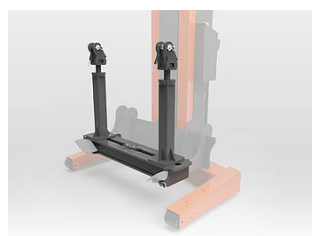
EHB907TRT412TR03 + EHB907TRT412LS03 Supports de charge, 8,5 T, longueur 1070 mm pour EAGLE IV/V