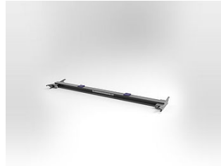
EHB907TR17 LKW-Traverse, 17 t, Länge 3000 mm