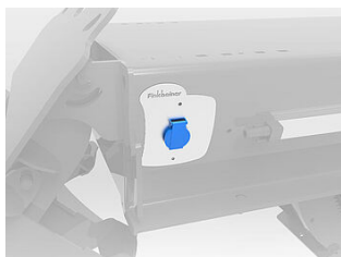
HDSF07-ST02 Steckdosen 230V