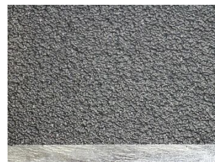
HDSF07-AS0X Antirutschoberfläche Rutschklasse R13