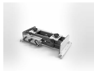
HDSMHFL160-200-F07 Achsfreiheber 16 t, pneumatisch