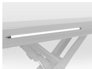
HDSF07-BL-LEDXX Set mit 4 bis 10 LED-Leuchten