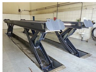
HDSF07DUROPLEX-XX Sonderlackierung zusätzlich zur Feuerverzinkung