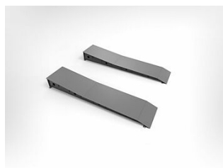
HDSF0713-330 2 Auffahrkeile, 3300 mm