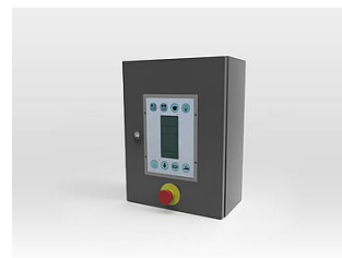
HDSF07-SK01 2. Steuerkasten im Waschraum