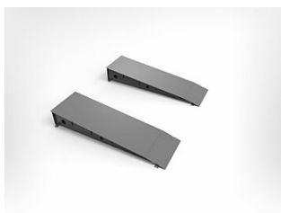
HDSF0713-235 2 Auffahrkeile, 2350 mm