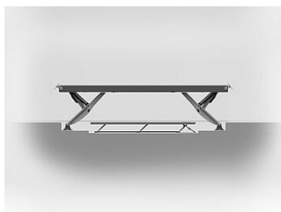
HDSF07BA-XXXXX Bodenausgleich für Fahrschienenrillen